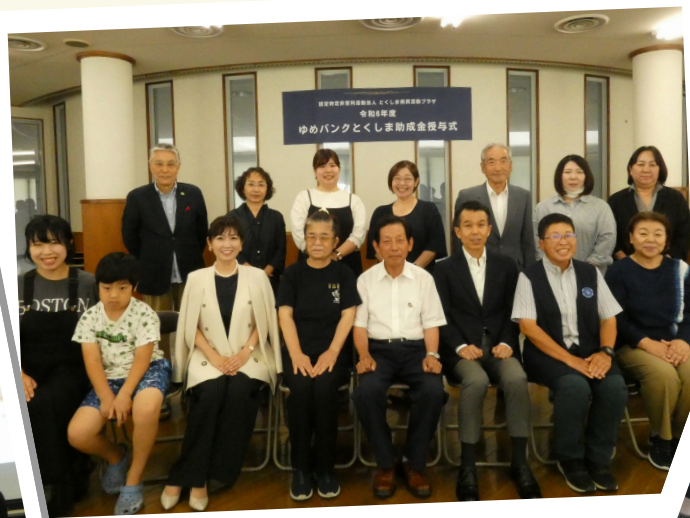
ゆめバンクとくしま