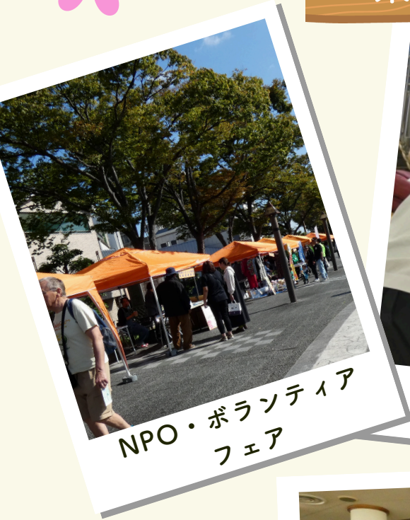
NPO・ボランティア フェア