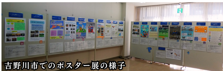
吉野川市でのポスター展の様子