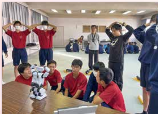
▲コミュニケーションロボット“パルロ”を使った体験学習の様子(高浦中学校)

令和6年度は新たな取り組みとして、夏休み等の長期休みを利用して見て、知って、感じてもらう「ふくしのおしごと夏休み1DAYチャレンジ」や、実際の仕事の体験を行う「福祉職場インターンシップ」も実施いたします。