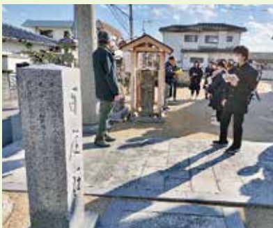
写真2 中高生が蛭子神社にある百度石を見学している様子

徳島市沖洲地区の蛭子神社にある百度石には、南海地震の周期性と地震後の津波と火災に関する教訓が記されています。南海地震は、江戸時代以降でも、慶長9年（1605年）、宝永4年（1707年）、嘉永7年（1854年）、昭和21年（1946年）といったように、およそ100年周期で発生しています。前回は1946年なので単純計算では、次は2046年となります。しかし、この石碑は1861年に建立されたために、近年では石の劣化がひどく、判読できる碑文が限られている状態でした。このような状態では、次の南海地震まで先人の教えを伝えていくことが難しいです。そこで、地域の防災士が声をあげ、神社の総代や氏子らが費用を工面し、徳島市社会教育課の協力を得て、2021年に百度石の修繕と再建が進められました。元の百度石はこれ以上劣化が進まないように木の覆屋で囲まれており、その横には碑文を刻んだ新しい百度石が建立されています（写真2）。このような石碑はその地域の人々の防災気運を高め、学びの場として活用していくことに意義があります。その価値が気づき、大切にしていきたいと思います。