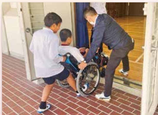
▲車いす体験学習の様子(喜来小学校)

小・中・高・大学生や福祉・介護の仕事に関心を持つ方などに、体験を通じて福祉に関わる機会を提供することによって、福祉に対する理解を深めることができると考えています。今後も、地域活動への参加を通して、子ども達の豊かな福祉観念の成長を図っていく福祉教育に、さらに取り組んでまいります。