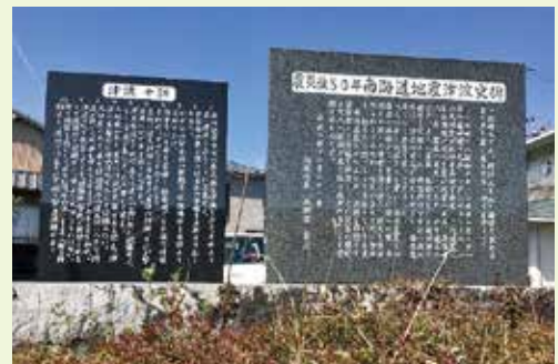
写真1 震災後50年北海道地震津波史碑と津波十訓の碑

この話は何度読んでも悲しく、胸がつまる思いになります。このようなことが二度と起こらないように、また犠牲者の冥福を祈るために、昭和南海地震から50年後の平成8年（1996）に石碑が建立されました。この石碑の隣には、日頃からの備えの大切さをまとめた「津波十訓」が刻まれた石碑があります。「一地区内に建てられた多くの昭和南海地震津波の最高潮位標識よりも高い津波もある、最小限の持ち出し品の準備、避難路・避難場所を決めておく、津波の前に潮が引くとは限らない、避難は早く近くの高いところへ、船の移動方法」などが書かれています（写真1）。