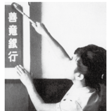
善意銀行 第一号支店 (小松島市)

徳島県内の善意銀行に関する詳細情報やボランティア活動への参加方法のお問い合わせは、お住いの市町村社会福祉協議会までご連絡ください。