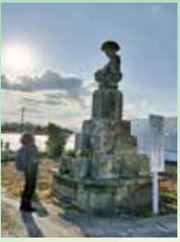
東黒田のうつむき地蔵

吉野川の下流域には台座高が10m以上の高地蔵が約190カ所確認されています。これだけ多くの高地蔵が密集して確認されているのは県内外でも吉野