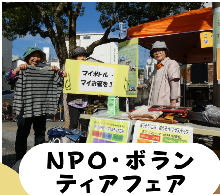
NPO・ボランティアフェア