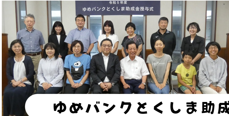
ゆめバンクとくしま助成金授与式