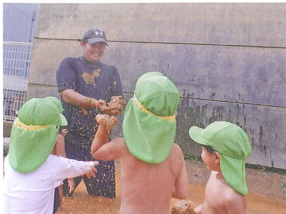
身体も心も解放できる泥んこプール

鳴門市撫養町にあるうずしお保育園に就職して15年、現在2・3歳児クラスの担任として23名の元気な子どもたちと毎日楽しく過ごしています。私が保育士を目指すきっかけになったのは、今まさに働かせていただいているうずしお保育園であり、中学3年生の時の職場体験をさせていただいた時でした。子どもたちと遊んだり、着替えなどを手伝ったりと大変そうでしたが、子どもたちから慕われ