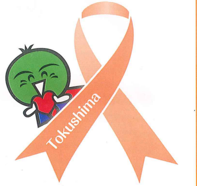
徳島県マスコット「すだちくん」

徳島県児童養護施設協議会では、「オレンジリボンすだちくんピンバッチ」を作成し、オレンジリボン運動を推進しています。収益金は、次年度以降のピンバッチ作成費用に充て、オレンジリボン運動の広がりにつなげます。ぜひ、お申し込みください。(1ヶ 500円(税込))