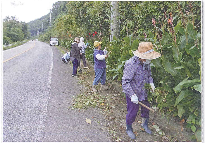
草刈り活動の様子