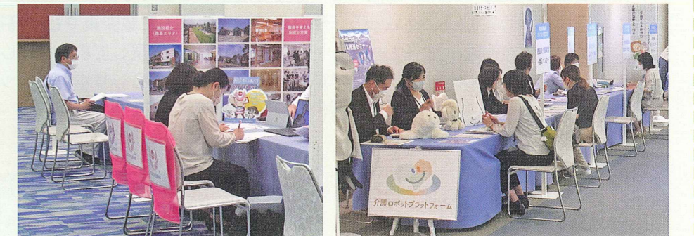
各相談ブースの様子

徳島県福祉人材センターでは、今後も福祉人材の安定的な確保と定着に向け、求職者と社会福祉事業所とのマッチングの機会を設けるとともに、福祉職場のネガティブイメージを払拭するための正確な情報発信に努めて参ります。