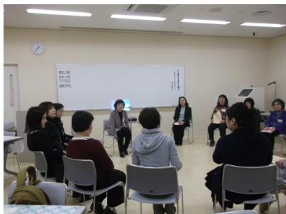
フレアキャンパス 企画委託事業

●総合講座・実践講座・委託事業の開催 専門知識を持った講師陣により各種講座を開催しています。