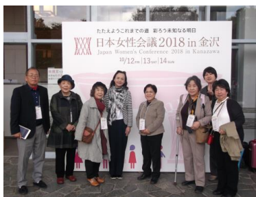
日本女性会議 2018 金沢

●国内外視察研修 日本女性会議や国立女性教育会館行事への参加や海外視察研修を行っています。