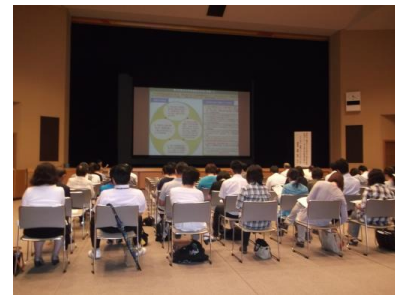
東かがわ市人権講演会 講師派遣

●国内外視察研修 日本女性会議や国立女性教育会館行事への参加や海外視察研修を行っています。