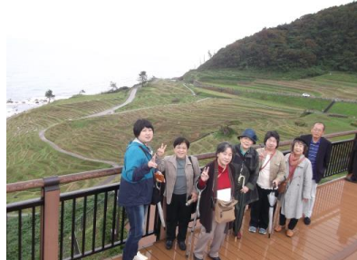
石川県能登半島観光 兼六園・輪島・白米千枚田など