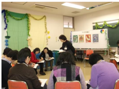
トゥルカラズ講座