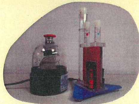
水の電気分解実験道具