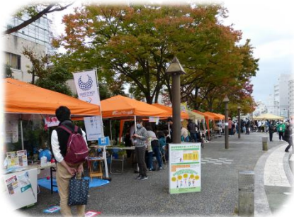
昨年のブースの様子